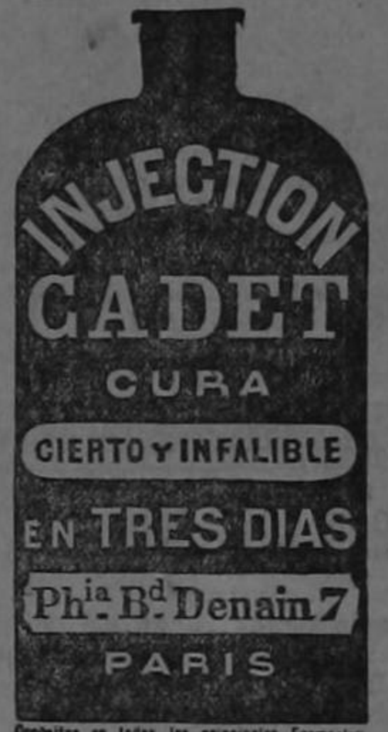
Disponibles en todas las principales Farmacias

Agentes generales en Cen. América, Jiménez & Co.